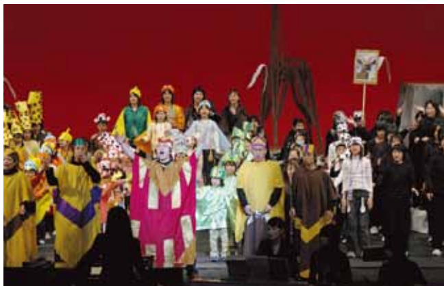
■ 虹のはしフェスタの模様です。いつもみんなが一体になってやったなあと思います。

「どやの」とは、福井弁で「どうですか?」「いかがですか?」という意味で、ボランティア活動などちょっと始めてみませんか?という思いが込められています。