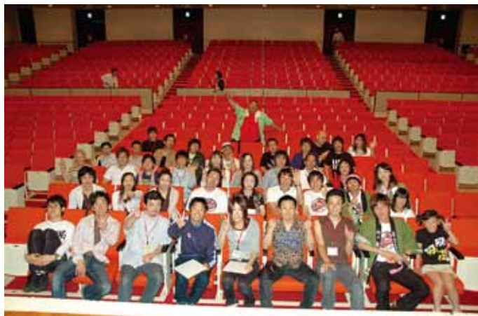
■ Live!チクル全国ネタ見せツアー福井公演。安田大サーカスなどの公演は盛り上がりました。苦労はあっても、吹っ飛びます。

どんな市民活動でも、それに通じるものがあると思います。人との関わりがどんどん広がって、その中で得るものがたくさんあり、自分を人として大きくさせてくれる、それが市民活動の魅力なんだと思います。